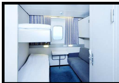
Cabina doble interior uso individual Cabina doble/triple exterior